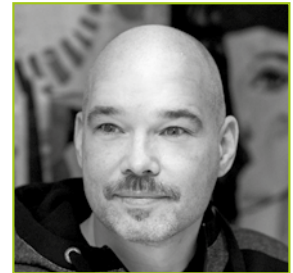
GORDON FEIL Layout & Druck